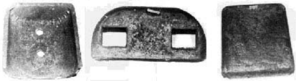
Елементи печі для плавки базальту .